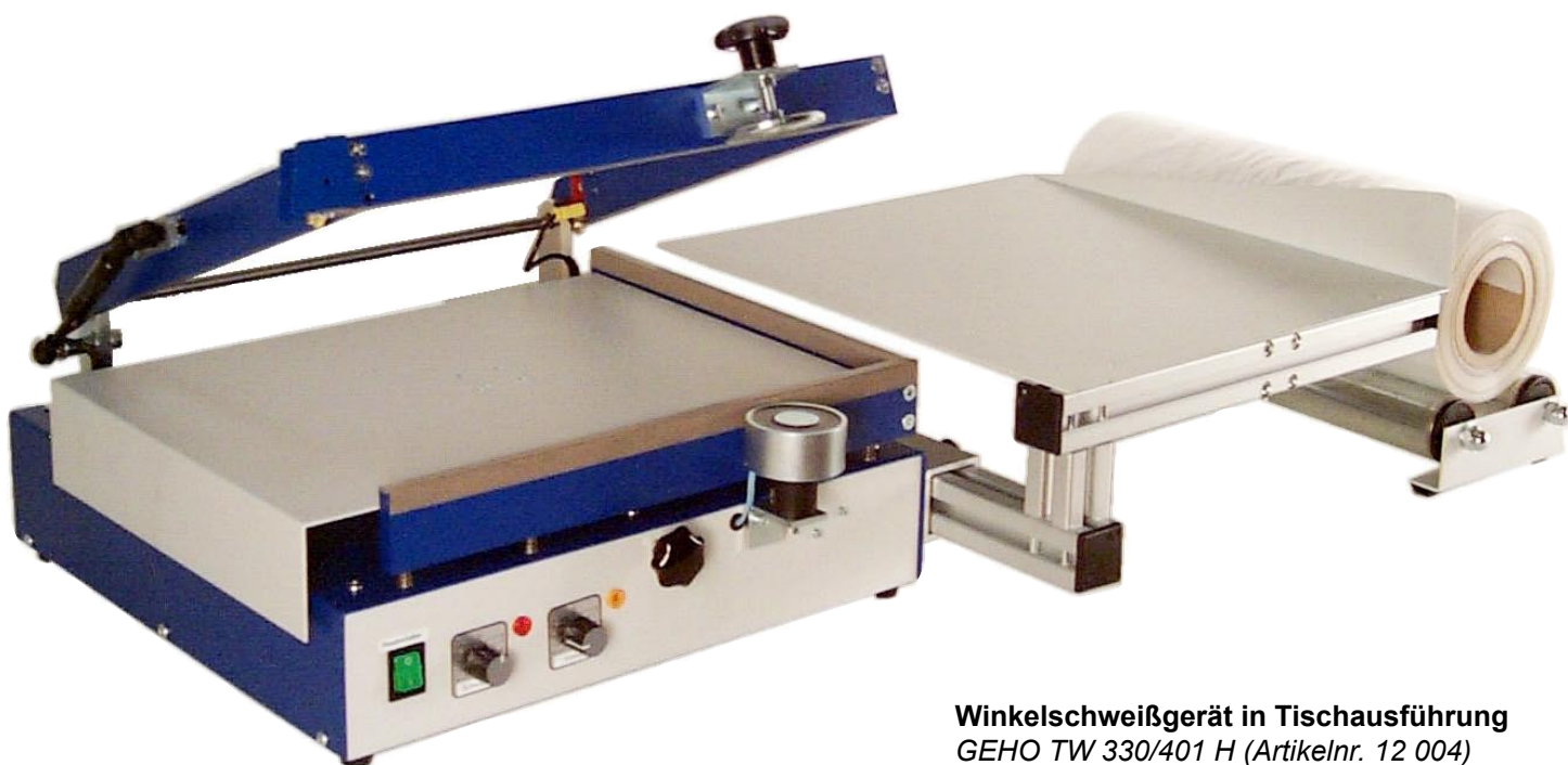
Winkelschweißgerät in Tischausführung GEHO TW 330/401 H (Artikelnr. 12 004)

FOLIENSCHWEISSGERÄTE SCHRUMPPACKANLAGEN PALETTEN-STRETCHWICKLER VERPACKUNGSMATERIAL Produktion und Vertrieb