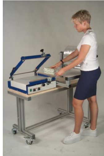
Abb. 1: Untergestell

Das Untergestell (Abb. 1) ermöglicht einen mobilen Einsatz des Gerätes. Die Arbeitshöhe kann auf die Bedienperson eingestellt werden. Es ist auch eine Stachelradwalze erhältlich.