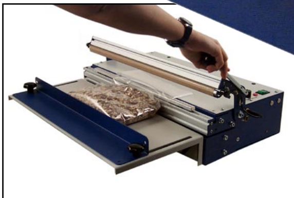
Gerät mit Auflagetisch GEHO TM 400 L (Artikelnr. 28 010) mit Auflagetisch (Artikelnr. 28 105)