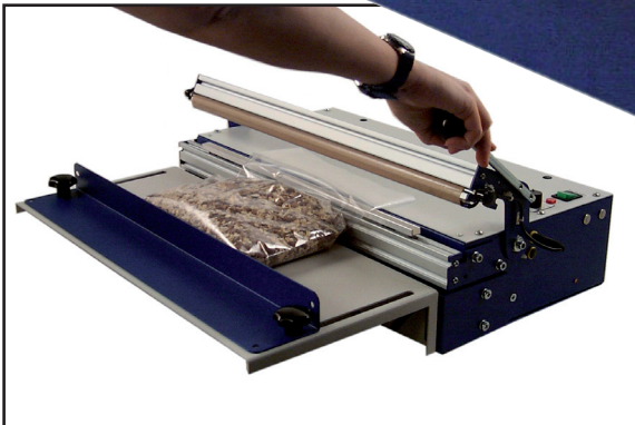
Gerät mit Auflagetisch GEHO TM 400 L (Artikelnr. 28 010) mit Auflagetisch (Artikelnr. 28 105)