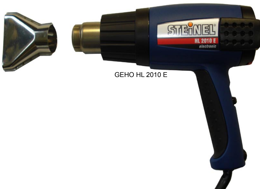
GEHO HL 2010 E

FOLIENSCHWEISSGERÄTE SCHRUMPFPAKANLAGEN PALETTEN-STRECHWICKLER VERPACKUNGSMATERIAL Produktion und Vertrieb