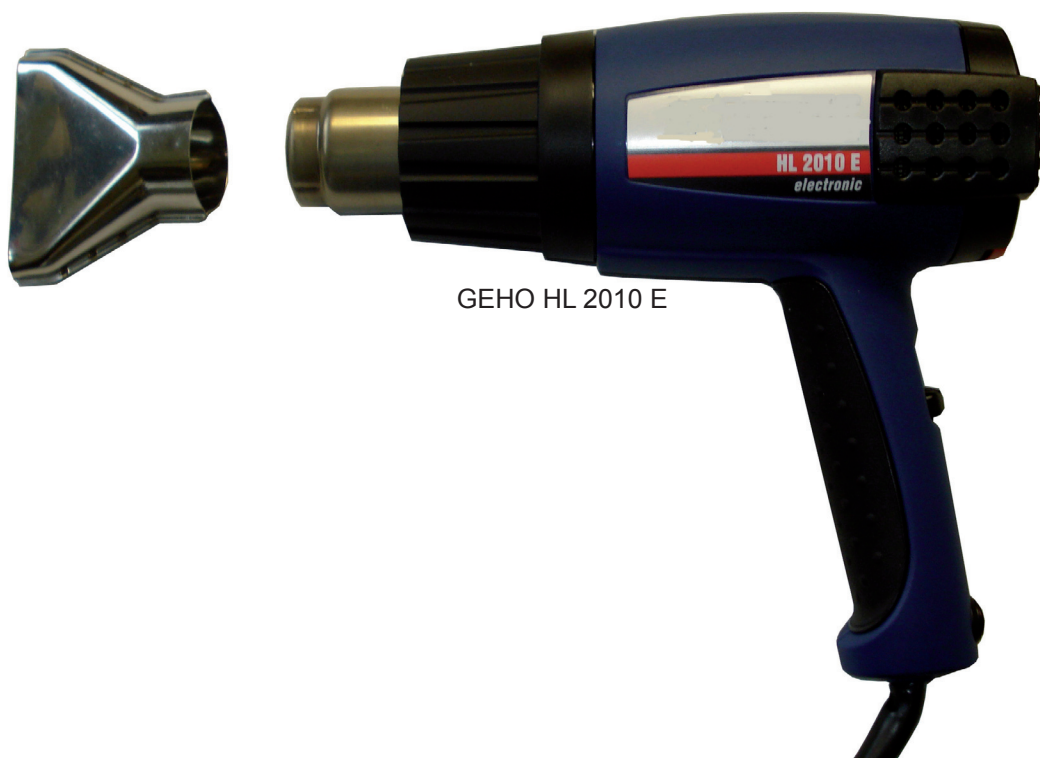
GEHO HL 2010 E

FOLIENSCHWEISSGERÄTE SCHRUMPFPACKANLAGEN PALETTEN-STRETCHWICKLER VERPACKUNGSMATERIAL Produktion und Vertrieb