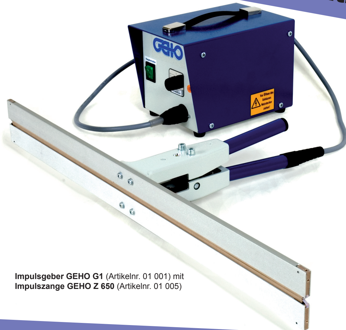
Impulsgeber GEHO G1 (Artikelnr. 01 001) mit Impulszange GEHO Z 650 (Artikelnr. 01 005)

FOLIENSCHWEISSGERÄTE SCHRUMPFACKANLAGEN PALETTEN-STRETCHWICKLER VERPACKUNGSMATERIAL Produktion und Vertrieb